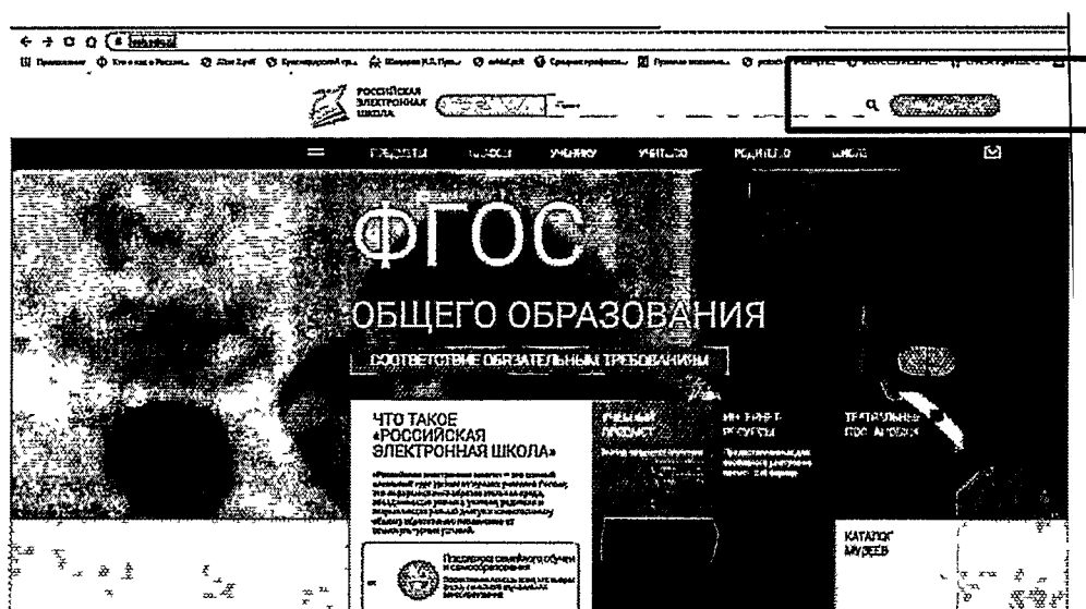
Рисунок 1. Главная страница

Шаг 3. В поле «Вы*» выберите «Учитель» и заполните поля (рис. 2)